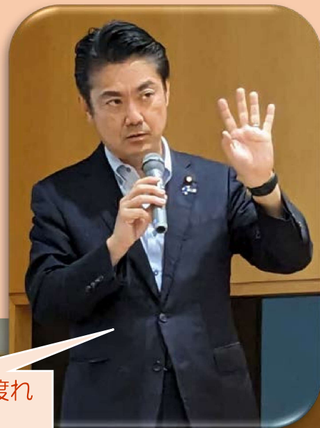
河を遡り、海を渡れ by 山下貴司

山下貴司議員は司法書士法改正当時の法務大臣です！ 東京大学法学部卒業。米国コロンビア大学ロースクールフルブライト奨学生。東京地検特捜部、日本大使館外交官として、EPAなど多数の条約交渉。公募に応じて霞が関を脱藩、平成24年衆議院初当選（岡山2区）、平成29年法務大臣政務官、平成30年政務官から一気に法務大臣！衆議院においては憲法審査会・法務委員会等でご活躍。自民党政務調査会副会長、空家対策推進議員連盟幹事長など。