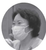
山田 美樹 衆議院議員