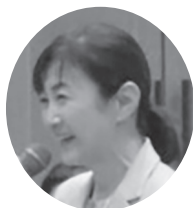
生稲 晃子 参議院議員