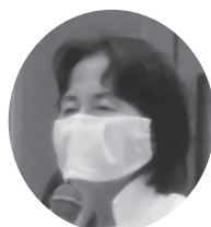
松島みどり 衆議院議員