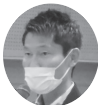
朝日健太郎 参議院議員