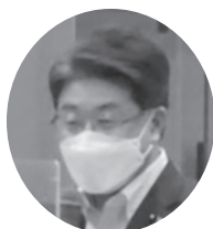
東村 邦浩 都議会議員