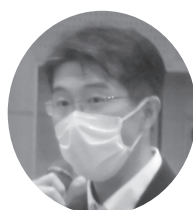
河西 宏一 衆議院議員