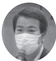
石原 宏高 衆議院議員