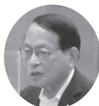
平沢 勝栄 衆議院議員