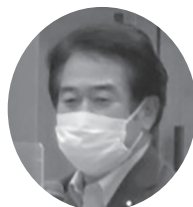
伊藤 達也 衆議院議員