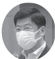
阿達 雅志 参議院議員