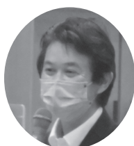
滝口 学 都議会議員