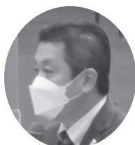
稲本 信広 日本司法書士会連合会専務理事