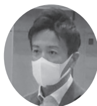
鈴木 隼人 衆議院議員