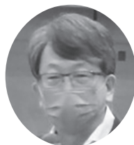
平 将明 衆議院議員