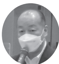
高木 啓 衆議院議員