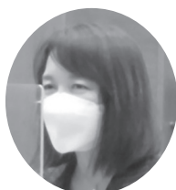
竹谷とし子 参議院議員