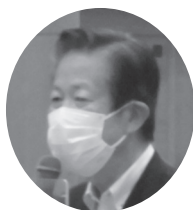
山口那津男 参議院議員