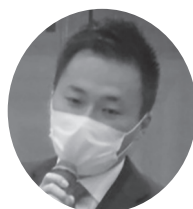
土田 慎 衆議院議員