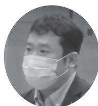
西澤 圭太 都議会議員