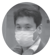
松本 洋平 衆議院議員